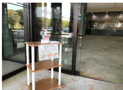
各箇所にアルコール消毒設置